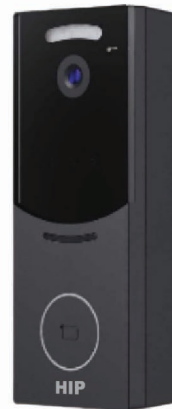
HS-IC64-M Video Door Phone