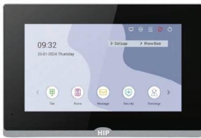
HS-VD61 Indoor Monitor