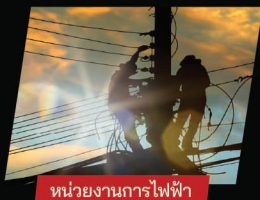
หน่วยงานการไฟฟ้า