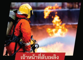
เจ้าหน้าที่ดับเพลิง