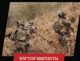
ทหารลาดตระเวน