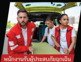
พนักงานรับผู้ประสบภัยฉุกเฉิน