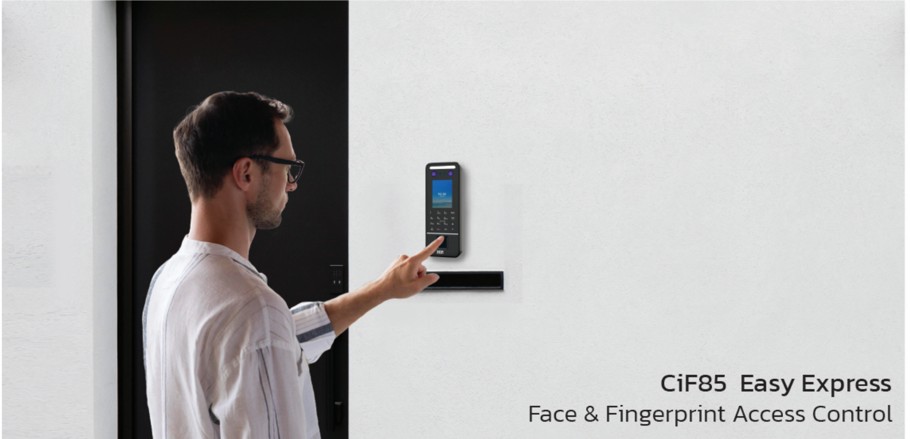
CiF85 Easy Express Face & Fingerprint Access Control