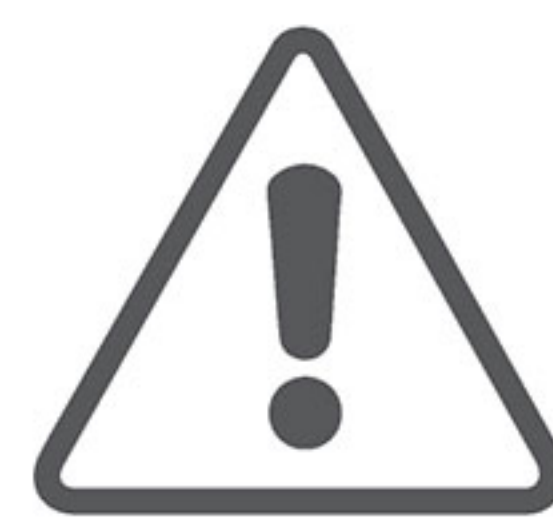
Low power reminder