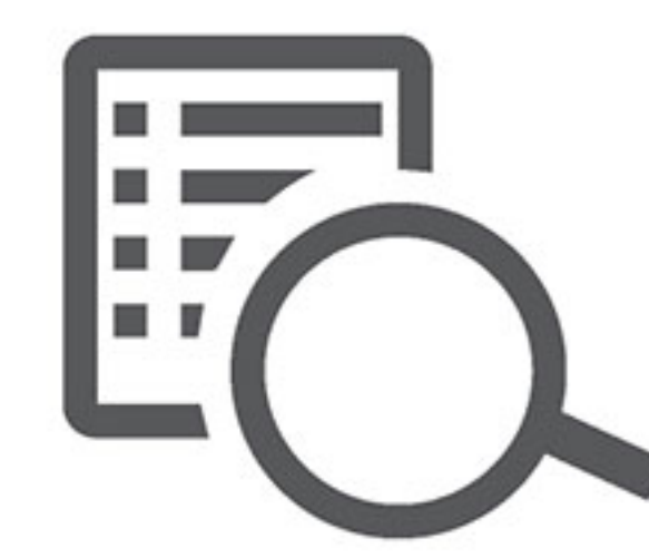
Query unlock records