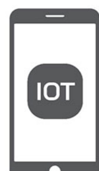
HIP IoT App Unlock