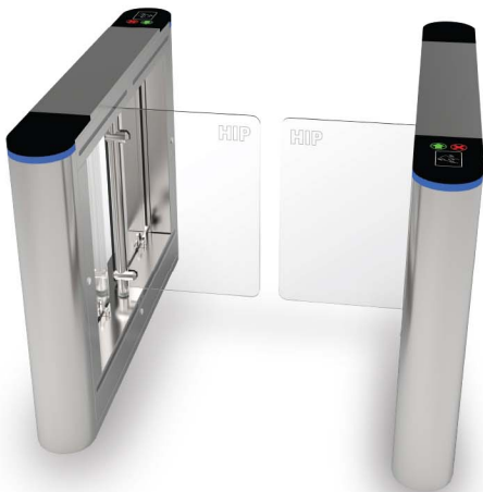
1400x185x1020mm Satin Stainless Steel 304 Automatic two-way swing