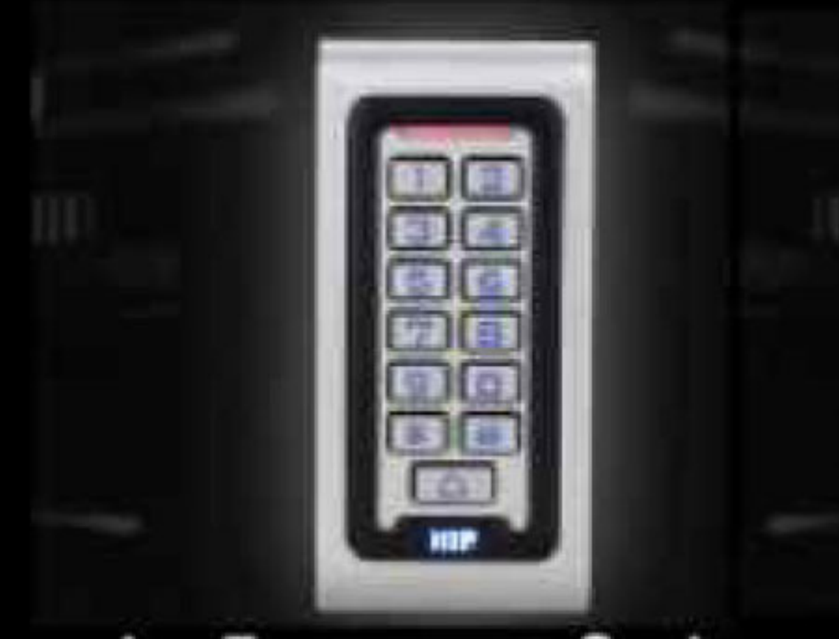
ปุ่มมีไฟแสดงผลในที่มืด