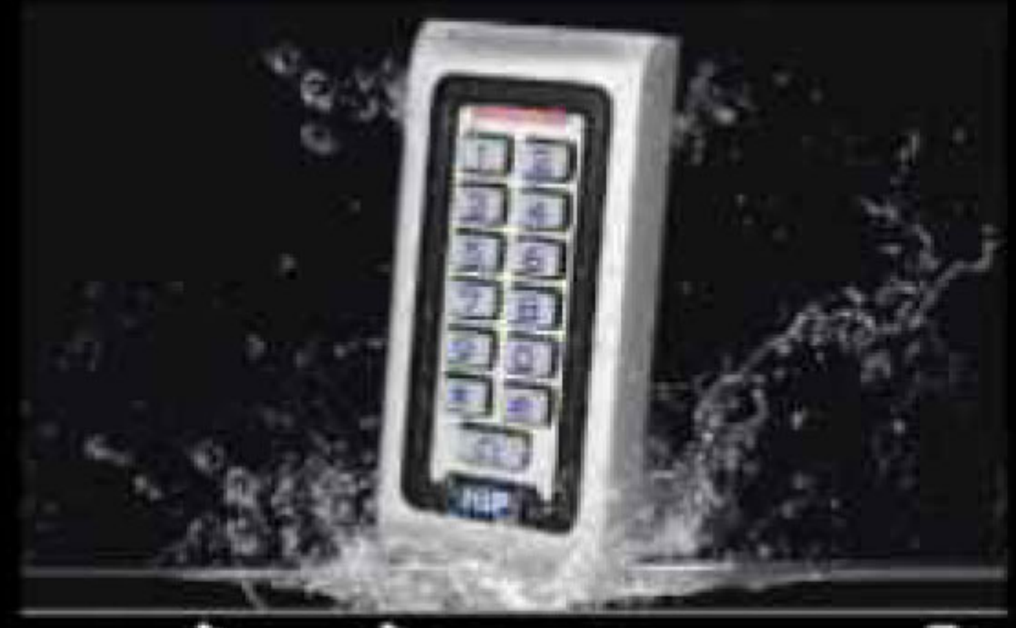
กันน้ำติดตั้งภายนอกอาคารได้