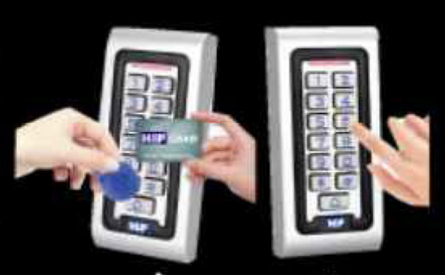
รองรับทั้งบัตร คีย์แท็ก และรหัส

ขอสงวนสิทธิ์ในการเปลี่ยนแปลงรายละเอียดทั้งหมดโดยไม่ต้องแจ้งให้ทราบล่วงหน้าโดย บริษัท เอช ไอ ซี ไทปอด จำกัด.