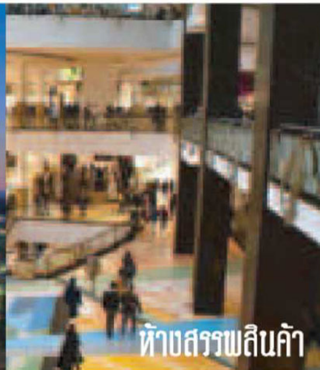
ห้างสรรพสินค้า