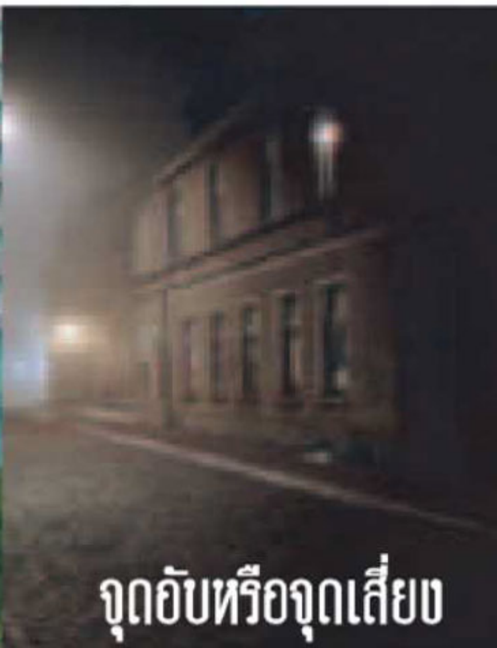
จุดอับหรือจุดเสี่ยง