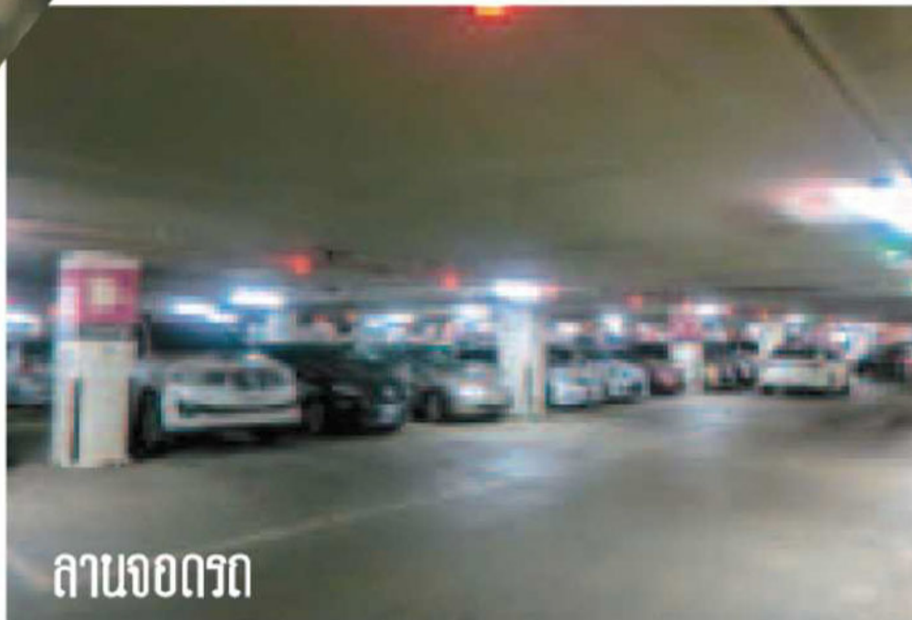
ลานจอดรถ