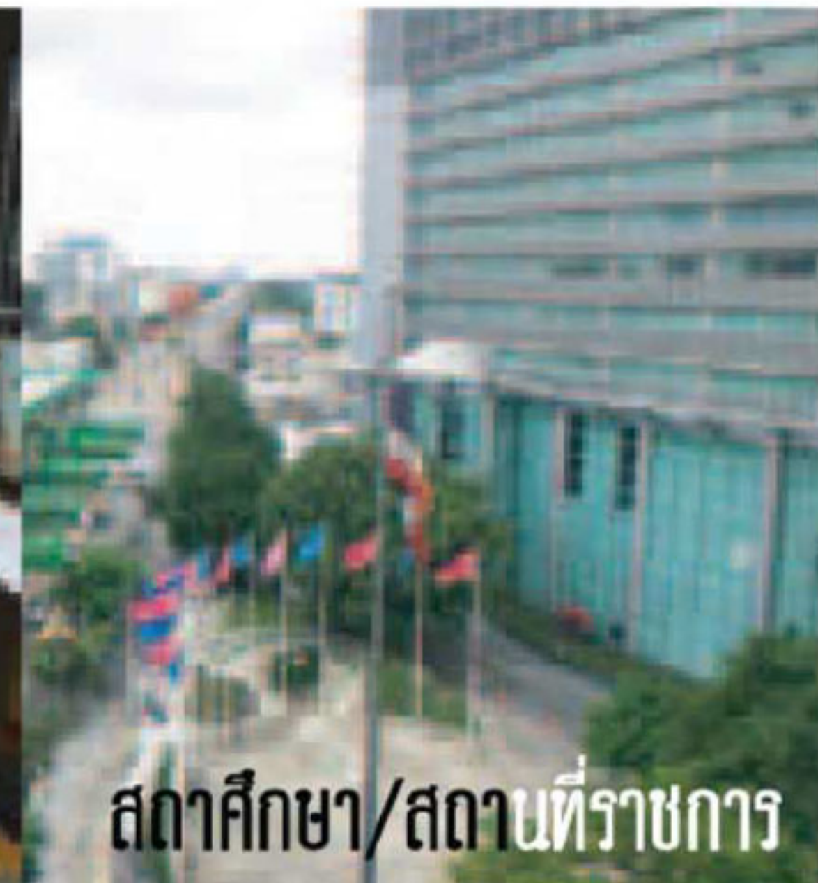
สถานศึกษา/สถานที่ราชการ