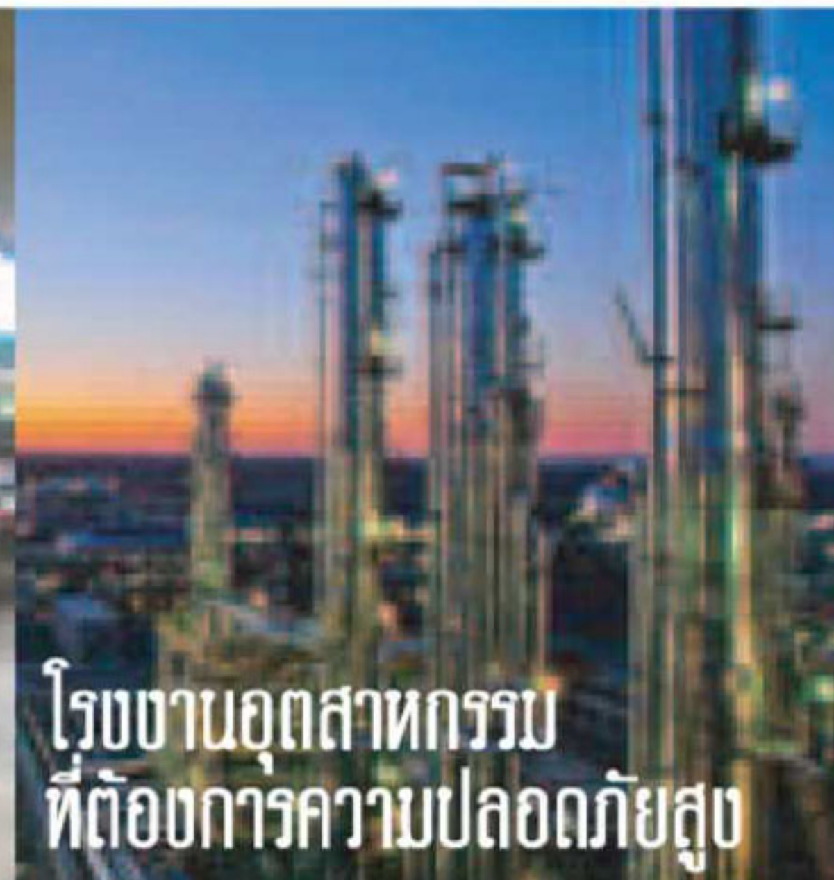
โรงงานอุตสาหกรรม ที่ต้องการความปลอดภัยสูง