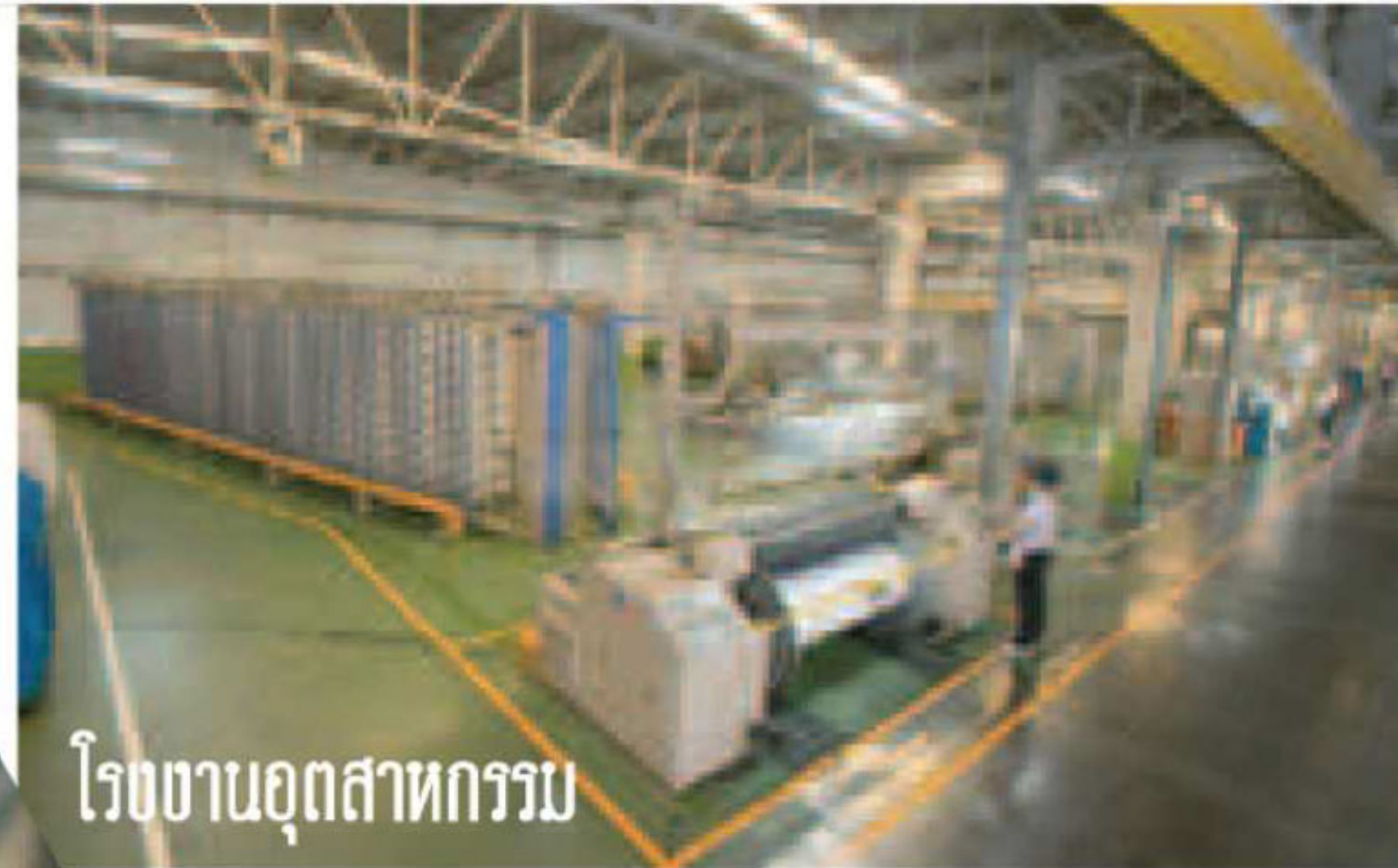
โรงงานอุตสาหกรรม